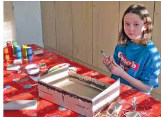
Werkeln und basteln standen neben viel Bewegung auf dem Ferienplan im Hort Brandis.

großzügig unterstützt haben! In der zweiten Woche ging es dann in die Vorbereitungen für unseren anstehenden Fasching. Dabei schmückten einige Kinder unseren Hort mit vielen bunten Girlanden und Luftballons, die anderen bereiteten in der Küche viele Naschereien vor. Am Faschingstag wurde eine große Party gefeiert und diese startete standesgemäß mit einer Polonaise durch die Einrichtung. Alle verkleideten sich oder wurden kunstvoll geschminkt, sodass man bei dem ein oder anderen Kind ganz genau hinschauen musste, wer sich unter der Maske verbirgt. Außerdem gab es spannende Spiele und Stationen zum Mitmachen. So konnten die Kinder Dosenwerfen, Bowlen oder sich beim Tanzen in unserer Disco austoben und Spaß haben. Wer wollte, konnte sich auch zwischendurch bei frischen Pfannkuchen, Muffins, Keksen, Würstchen im Schlafrock und roter Brause stärken. Am letzten Ferientag, dem Fledermaustag, konnten die Kinder die Seele baumeln lassen. Die einen