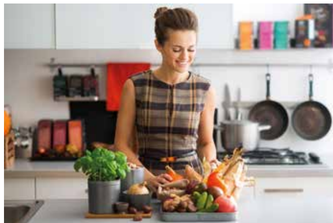
Eine basenüberschüssige Ernährung mit viel Obst, Gemüse und vollwertigem Getreide schafft gute Voraussetzungen für sportliche Leistungskraft.

Grundsätzlich sollte das Outdoor-Training – gerade nach längerer Pause – langsam und mit Bedacht angegangen werden. Dafür zieht man beispielsweise erst einmal kürzere Aktiveinheiten durch und steigert sich dann Stück für Stück. Viele Tipps finden sich auch im Fitness-Ratgeber „Basisch erfolgreich“, der unter www.p-jentschura.com kostenlos bestellt werden kann. So sind für die Entlastung nach dem Training Bäder mit basischen Pflegesalzen ein wertvoller Rat. Alternativ können basische Wickel oder Strümpfe die Entsäuerung des Gewebes fördern. Zu guter Letzt gilt es, nach jedem sportlichen Einsatz eine Pause von mindestens 12 Stunden einzulegen und so dem Körper Zeit für die Regeneration zu geben.