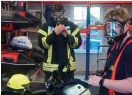
Lehrgänge und Dienste gehören bei den Freiwilligen Feuerwehren dazu. Unter anderem werden Kameraden im Tragen von Atemschutzgeräten geschult.

Am 4. Februar hielten wir nach zweijähriger Pause unseren Jahresrückblick im