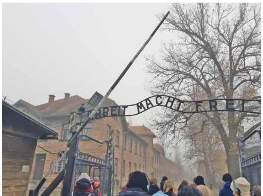
Beklemmender Besuch im ehemaligen Konzentrationslager.

te Nummer des Lagers für immer an ihrem Arm. Da sie im Lager von ihrer Mutter getrennt wurde, hatte sie in ihrem jungen Alter nie Zuneigung und Liebe erfahren können, weswegen sie noch heute ihren eigenen Sohn nicht in den Arm nehmen kann. Das zeigte uns, dass selbst die Überlebenden von dem Lager große Schäden davongetragen haben,