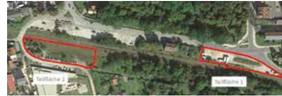
Die Entwicklung der Teilfläche 1 soll eher für Jugendliche und Erwachsene sein, Teilfläche 2 orientiert sich an den Bedürfnissen von kleinen Kindern.

Auf der zweiten Teilfläche, gegenüber der Kita Purzelbaum, könnten Spielgelegenheiten beispielsweise im Stil von einer Lok oder einem Zug für die kleineren Kinder entstehen. Neben Schaukel und Kleinspielgeräten sind auch hier Sitzmöglichkeiten und Picknicktische denkbar. Die Erfahrung zeigt, dass der Spielplatz in Beucha, der sich ebenfalls direkt vor der dortigen Kindertagesstätte befindet, sehr gut angenommen wird. Viele Eltern nutzen die Möglichkeit, die Kinder klettern und spielen zu lassen und sich mit anderen Eltern zu treffen. „Deshalb denken wir, dass es Sinn macht, für die Kleinsten entsprechende