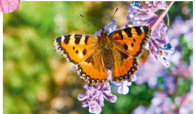
Beliebt bei Schmetterlingen: Sommerflieder, hier genießt ein Kleiner Fuchs

Weitere Informationen erhalten Sie auch unter www.raumzauber-sinnwelt.de/bienen