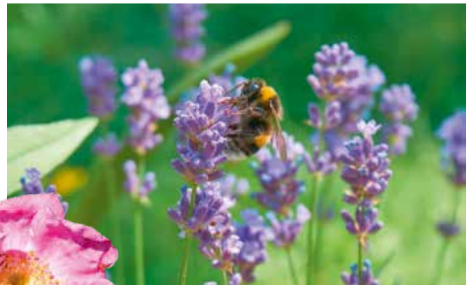
oben: Wohliges Nektarbad: Hummel in Lavendel. links: Ungefüllte Rosen bilden eine wertvolle Nahrungsquelle

Für jeden Standort gibt es passende Blühpflanzen. Die Floristikfachgeschäfte Raumzauber-Sinnwelt in Naunhof und Leipzig / Engelsdorf halten eine große Pflanzenauswahl für Sie bereit und beraten Sie gern zu insektenfreundlichen Pflanzenarten rund ums Jahr.