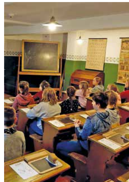
Bei einem Ausflug lernten die Kinder die Schule wie vor rund 100 Jahren kennen.