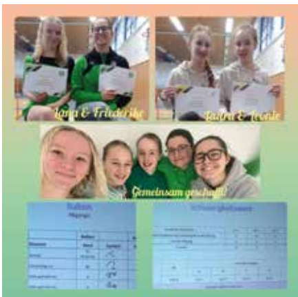
Die vier Turnerinnen haben den Kampfrichterlehrgang bestanden.

Abteilung Turnen SV Tresenwald e.V. Machern und SV Stahl Brandis e.V.