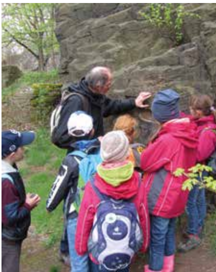
Bei den monatlichen Treffen erfahren die Teilnehmer mehr über die Region und Natur.

Die Vielfalt und Geheimnisse der Natur entdecken, den Wald mit allen Sinnen wahrzunehmen, sich für den Naturschutz einzusetzen und viel Zeit unter freiem Himmel zu verbringen - darum geht es im Projekt „Junior Ranger“ der Volkshochschule Landkreis Leipzig in Kooperation mit dem Geopark Porphyryland. Schüler im Alter von 10 bis 12 Jahren, treffen sich im Ausbildungsjahr einmal im Monat samstags von 9 bis 16 Uhr an verschiedenen Orten im Landkreis. Die Kinder erfahren Spannendes über die Besonderheiten der Region, streifen zusammen durch die Heimat und entdecken deren Vielfalt und die Geheimnisse der regionalen