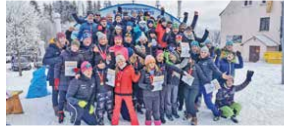
Die Beuchaer Skilanglaufsportler feierten in Johanngeorgenstadt einen neuen Allzeitrekord.

Mit dem Pokal und einer guten Portion Motivation im Gepäck gehts in Richtung