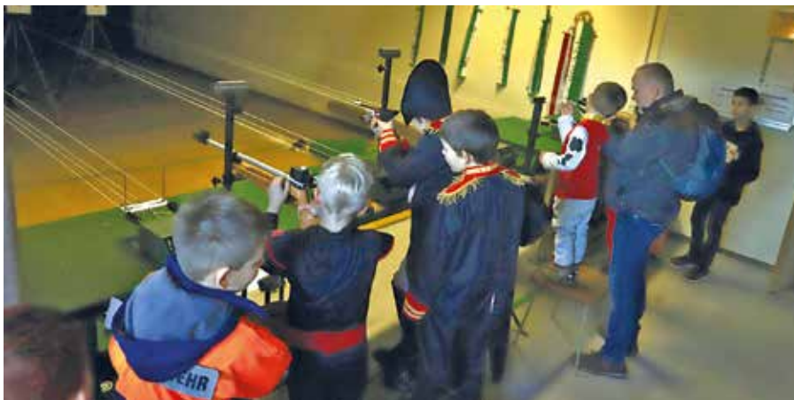
Die verkleideten Kinder konnten sich u.a. beim Licht-Schießen probieren.

Der Heimat- und Kulturverein Polenz e.V. bedankt sich bei allen Helfern bei der Freiwilligen Feuerwehr Polenz für die Unterstützung des Faschingsumzugs sowie bei Rolf Heymann, der den Kindern mit Rat und Unterstützung zur Seite stand und ihnen das Licht-Schießen erklärte.