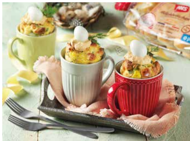
Leckeres für den Osterbrunch: Die pikanten Oster-Mug-Cakes werden mit Wachteleiern dekoriert.