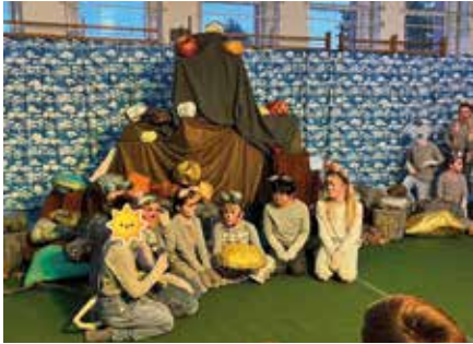
Die Theater-Aufführung in Beucha war ein voller Erfolg.

Es ist seit Jahren – eigentlich seit Jahrzehnten – Tradition, dass die Kinder der Theater AG zum Ende des ersten Schulhalbjahres das bis dahin einstudierte Theaterstück vor ihren Eltern und Geschwistern aufführen. Durch die lange Pause der letzten drei Schuljahre