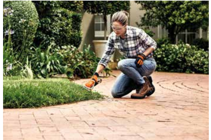
Die neue Gartensaison kann kommen. Mit etwas Pflege erstrahlt das Freiluftwohnzimmer neu.

von Hecken und anderen Pflanzen können die Gartenbesitzer noch rasch die Nistkästen säubern, damit sich die gefiederten Untermieter während der warmen Jahreszeit wohlfühlen. Und die kann kommen, nachdem auch auf Gartenwegen, der Terrasse und den Gartenmöbeln die Hinterlassenschaften des Winters beseitigt wurden. Ein kurzer Einsatz des Hochdruckreinigers reicht bereits aus, damit die Lieblingsstühle für draußen wieder frisch erstrahlen. Mit Flächenreiniger und Reinigungsmitteln lassen sich auch Bodenplatten und Terrassenbeläge einfach und schnell säubern.